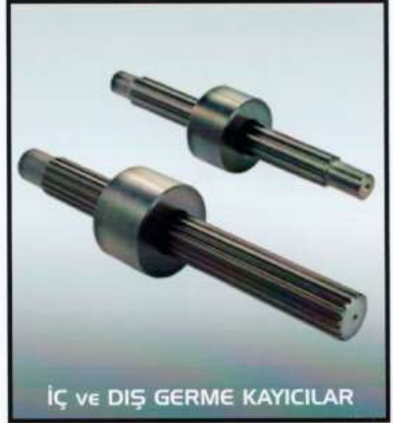
İÇ VE DIŞ GERME KAYICILAR