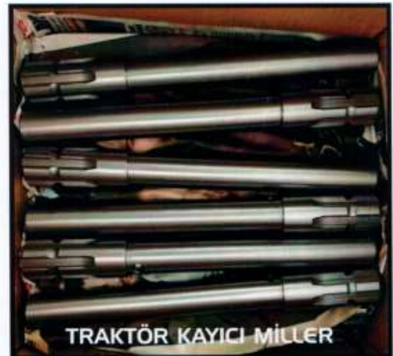
TRAKTÖR KAYICI MİLLER