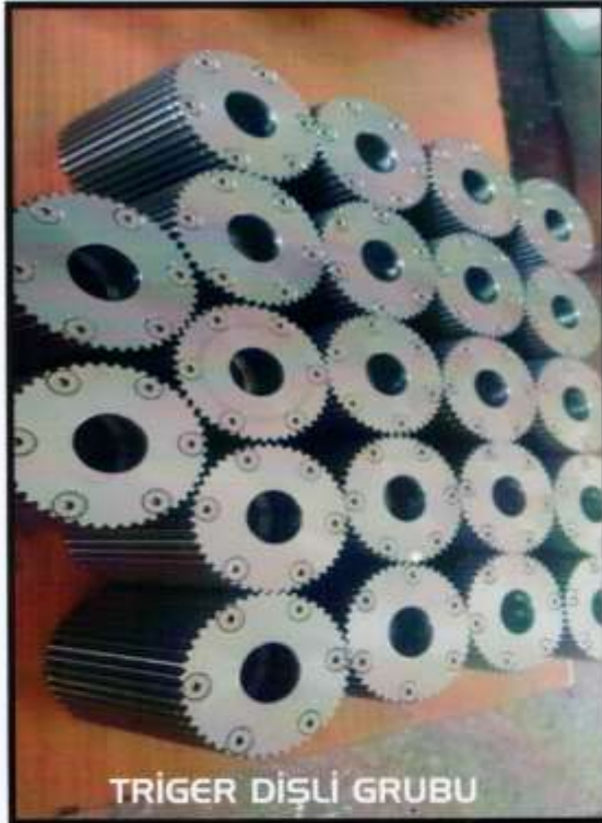
TRİGER DİŞLİ GRUBU